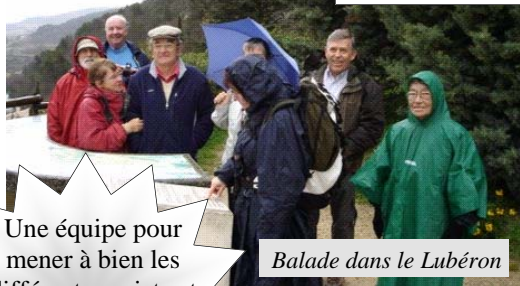
Balade dans le Lubéron

un nouveau Conseil d'administration a été élu, celui-ci a élu le Bureau de Surdi13