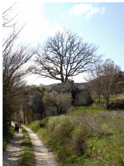
Balade dans le Lubéron